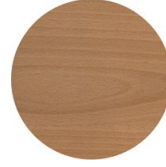
Buche Eiche gefärbt