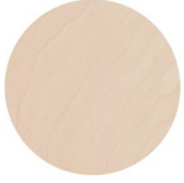
Buche Ahorn gefärbt