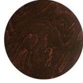
Buche wengé gefärbt