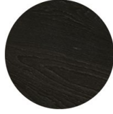
Buche Schwarz gefärbt