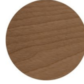
Buche Nussbaum Canaletto gefärbt